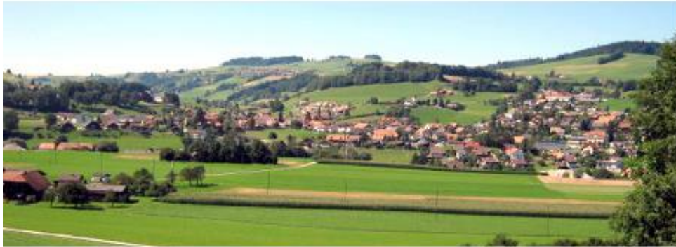
Toffen Kaufdorf Thurnen