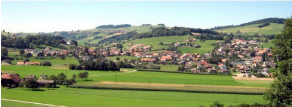
Toffen Kaufdorf Thurnen